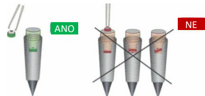
Vkládání filtru/otvíracího trnu

Držte Freezpen tak, aby špička směřovala dolů. Filtr vložte naplocho na dno dutiny. Otvírací trn musí směřovat svisle nahoru. Vyjměte náplň z obalu a vložte ji úzkým koncem směrem dolů do dutiny nad filtr/otvírací trn.