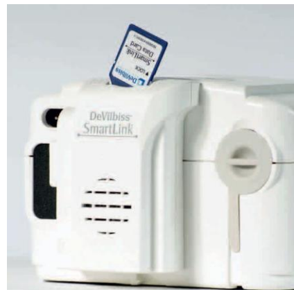
SleepCube AutoBilevel s připojenou jednotkou SmartLink