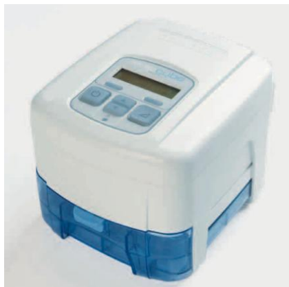
SleepCube s integrovaným vyhříváním zvlhčovačem

Tlak BIPAP se zvyšuje v reakci na příhody pomocí algoritmu automatické regulace. Rozpětí tlakové podpory nemůže překročit MAX IPAP a nemůže být nižší než MIN EPAP